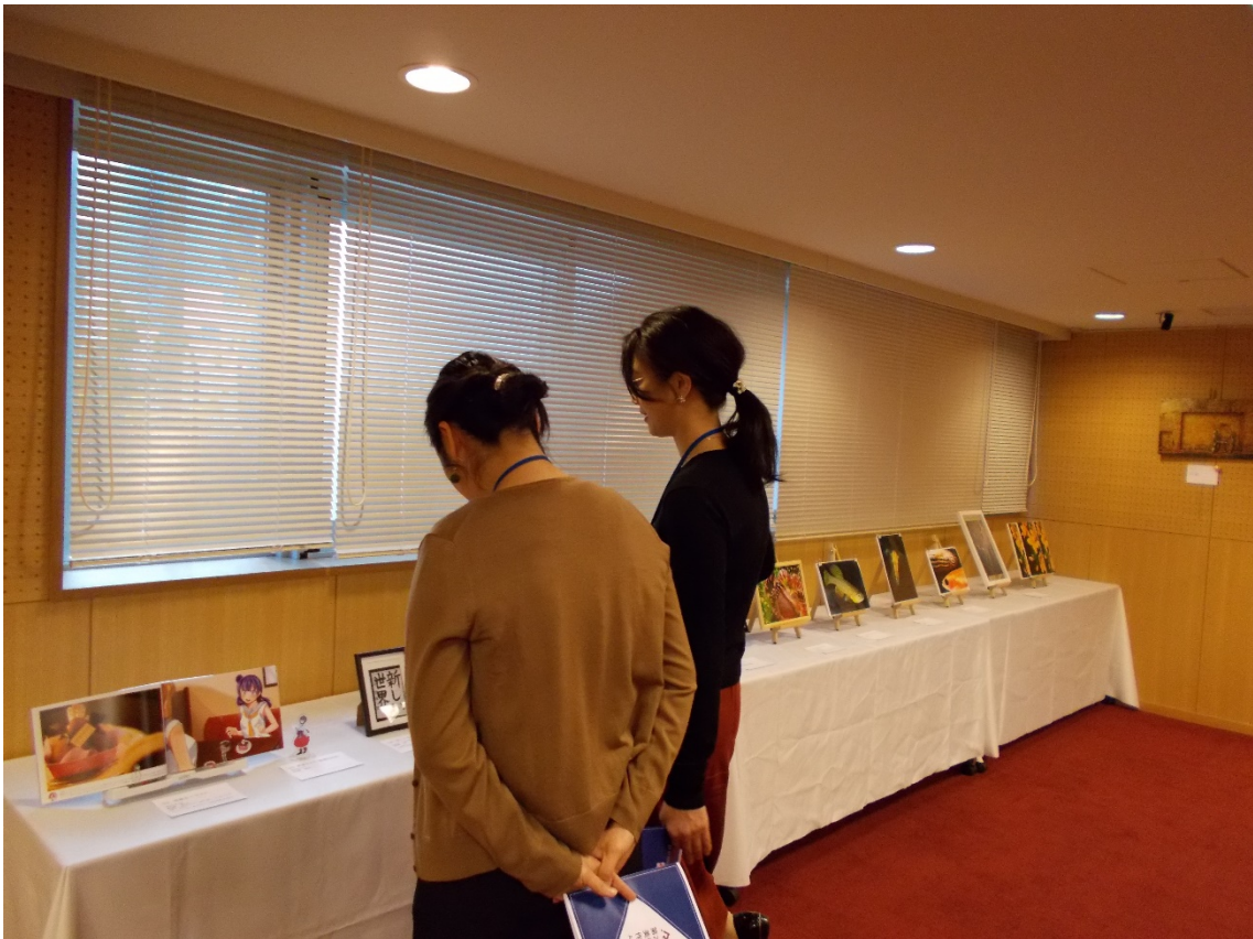
写真展示に見入る来場者